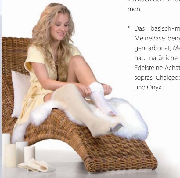
Mit BasischenStrümpfen entspannt in allen Ruhephasen.