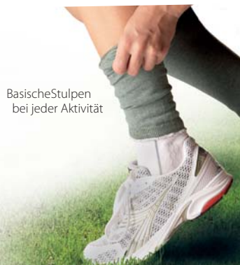
BasischeStulpen bei jeder Aktivität