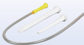
Flexible Einlaufhilfe, Mutterrohr und Klistierrohr

Ein Einlauf, ein- bis zweimal pro Monat, oder in einer Fastenkur auch häufiger, ist eine wirkungsvolle Entlastung für den Darm und unseren Organismus.